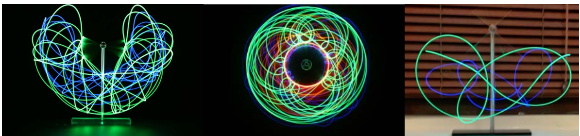
LEDライトの軌跡の写真 (スマートフォンで撮影)

さらに回転する支点や支柱を追加することで重さや形状をカスタマイズすることができ、カオスな動きを自分好みに追求できます。またLEDライトを搭載してカメラで撮影することで、アートな動きの軌跡を視覚化します。科学や物理に興味を持ってもらう理科教材として、またハンドスピナーのようなリラクゼーションツールとしてお楽しみいただけます。「あたらしい動き」、「カオス」を体感して下さい。